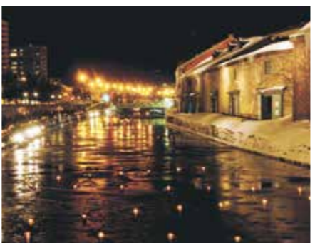
運河に幻想的な光が灯る「小樽雪あかりの路」

作り方も、当時から変わらな い吹きガラス製法。約1300 度もの高温溶解炉で熱したガ ラスを長い吹き竿に巻き付け て、お椀のような型の中でく ると回しながら息を吹き込 み、球体にしていきます。大き さは直径約45センチから6セ ンチまであり、成形した後、竿 から切り取って「へそ」と呼ば れる穴を塞ぐガラスを付けて 完成。温度が要となる作業の ため、溶解炉から出してあっと いう間に作り上げる様は、ま さに職人技です。