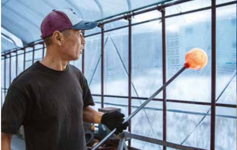
何度も吹き、回しながら調整する。すべてが感覚という職人技

「ニシン漁では、縄を浮かせる浮き玉という道具が必要になります。元々は木や竹で作られていましたが、次第に耐久性も浮力も高いガラス製の浮き玉が主流となりました。昭和22年ごろには千トン以上の浮き玉が作られていたと