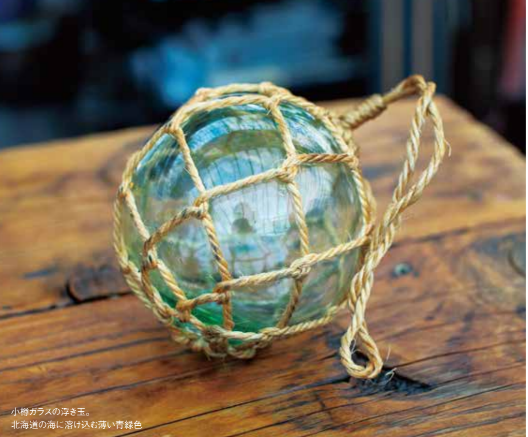
小樽ガラスの浮き玉。 北海道の海に溶け込む薄い青緑色